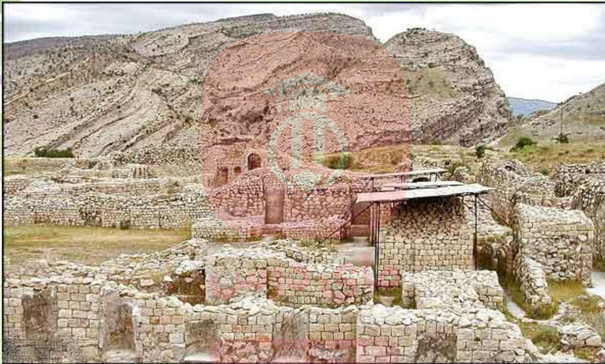
بقایای شهر بیشابور در نزدیکی کازرون